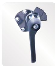
Chiusura con camma, sinistra: Cod. 6300-020002