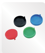
Tappo decorativo: rosso Cod. 6300-020010 verde Cod. 6300-020011 nero Cod. 6300-020013 blu Cod. 6300-020014