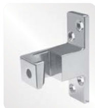
Nasello, destro: Dimensione X = 20 mm Cod. 6300-020005 Dimensione X = 38 mm Cod. 1750-010162