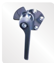
Chiusura con camma, destra: Cod. 6300-020001