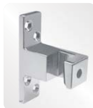
Nasello, sinistro: Dimensione X = 20 mm Cod. 6300-020004 Dimensione X = 38 mm Cod. 1750-010161